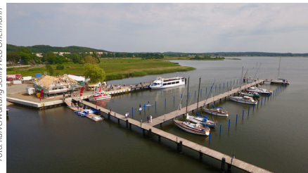
Der neue Selliner Hafen aus der Luft

Selliner Hafen am 1. Juni eröffnet Insel Rügen. Das Hafennetz Rügens verfügt seit der Eröffnung des Selliner Hafens am 1. Juni 2018 über einen neuen Anlaufpunkt für Schiffstouren. Bereits vor zwei Jahren wurde die Fahrrinne auf einer Länge von 380 Metern, einer Breite von 20 Metern und einer Tiefe von bis zu 2,40 Metern ausgebaggert. Anschließend