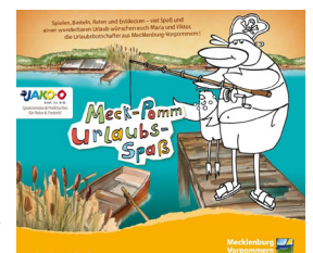
Titel des Urlaubsspaß-Heftes

In Vorbereitung auf die Hauptsaison können familienorientierte Unterkünfte das „Meck-Pomm Urlaubsspaß“-Heft für ihre Gäste von vier bis zehn Jahren kostenfrei beim TMV unter www.tmv.de/qmf bestellen. Das 20-seitige Beschäftigungsheft, das in Kooperation mit „JAKO-O“, dem Anbieter für Kinderprodukte, entstanden ist, enthält Rätsel-, Bastel- und Malaufgaben sowie Wissenswertes zum Familienreiseland Nr. 1.