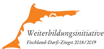
Logo der Weiterbildungsinitiative

zielte Fortbildung und Schulung der Mitarbeiter. In diesem Jahr werden die Seminare erstmals in Zusammenarbeit mit